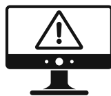
基于文件的恶意软件